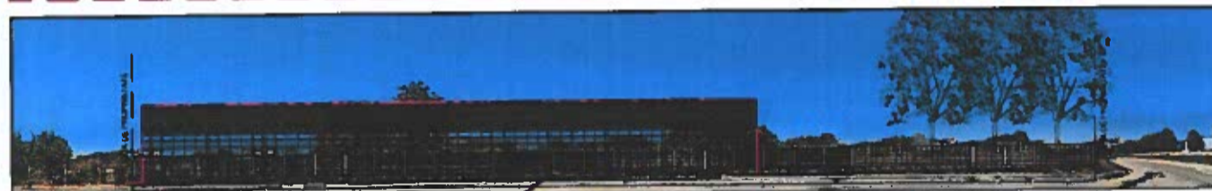
PROPUNERE - DESFĂȘURARE SUD, aleea PORTULUI